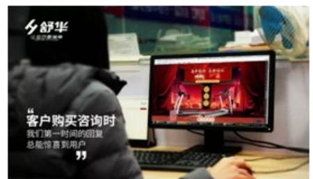
舒华天猫、京东旗舰店客服

春节快来啦！相信很多人都已经放假，买好车票，准备踏上回家路。但在舒华，仍有这么一群可爱的人，他们没有回家，仍然坚守在岗位上为客户排忧解难。让我们一起来听听他们的故事吧！