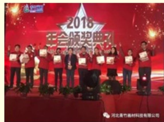
2018年青竹公司优秀员工、优秀团队颁奖典礼

告别2017，展望2018！我们将以更加饱满的热情和高昂的斗志，投入到新的一年当中去，为实现中国第一、世界一流而不懈奋斗！