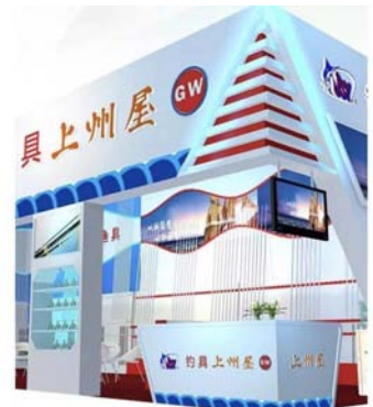
上州屋将在 N5馆-457展位欢迎各位

一直以来，光星、上州屋凭借过硬的产品品质与完善的售后服务质量获得了全国各地经销商伙伴的好评，这种认可是光威最为珍视的财富，同样也是激励光威不断前行，勇于创新的动力