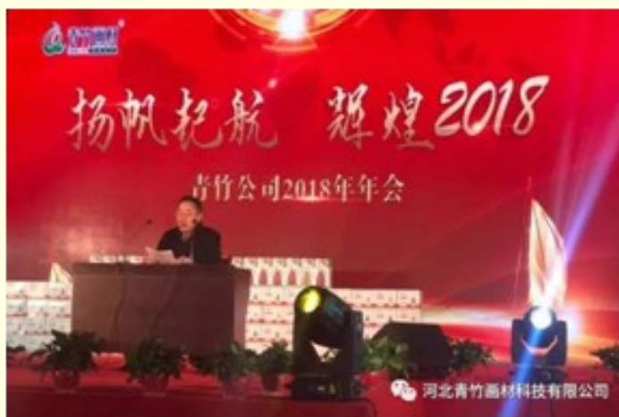
河北青竹画材科技有限公司刘董事长致词