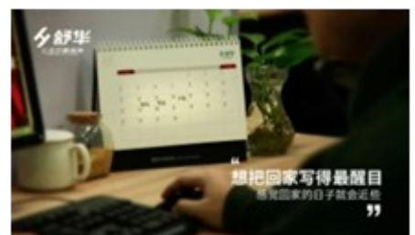
线下舒华百家门店真诚为你守候