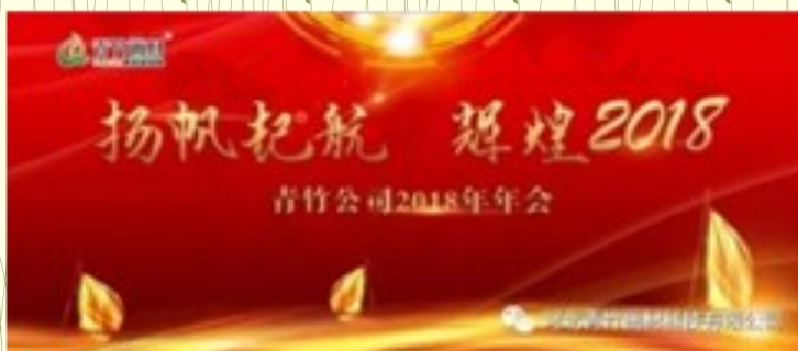
青竹画材2018年年会及优秀员工表彰大会落下帷幕