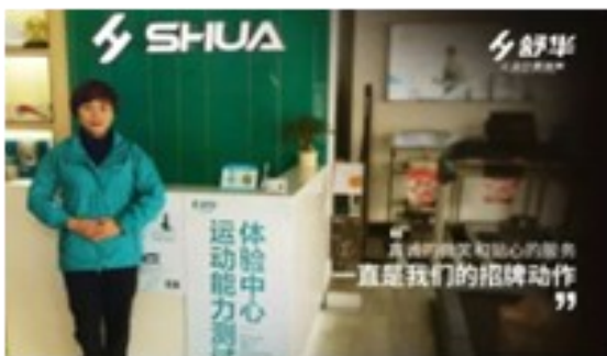
我们春节“不打烊” 过年年货来舒华选购